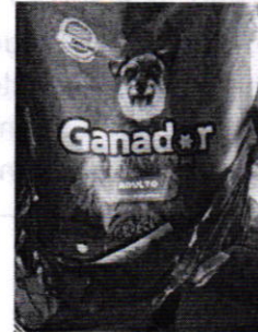
Fotografías 2 y 3. Vista de los recipientes y alimento del ejemplar canino motivo de denuncia.

En virtud de lo antes expuesto, esta Entidad considera procedente emitir la presente resolución, de conformidad con el artículo 27 fracción VI de la Ley Orgánica de esta Procuraduría, por imposibilidad legal, al no constatar irregularidades en materia de bienestar animal.