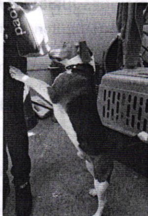
Fotografía 1. Vista del ejemplar canino que responde al nombre de "Kenny"