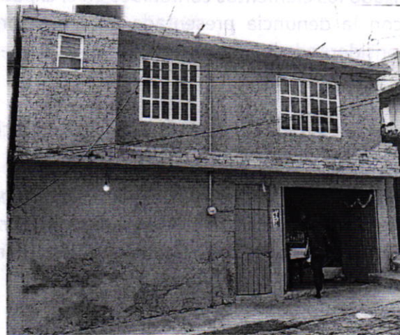
Fotografía 1. Vista del sitio referido en el escrito de denuncia.

En este sentido, personal de esta Subprocuraduría realizó un reconocimiento de hechos de acuerdo a lo establecido en el artículo 15 BIS 4 fracción IV de la Ley Orgánica de esta Entidad, durante el cual no fue posible ingresar el domicilio en comento; no obstante, una persona habitante del lugar informó que en la azotea del sitio de referencia se encuentran dos ejemplares caninos, de los cuales desconoce su situación, toda vez que no tiene acceso a dicho espacio.