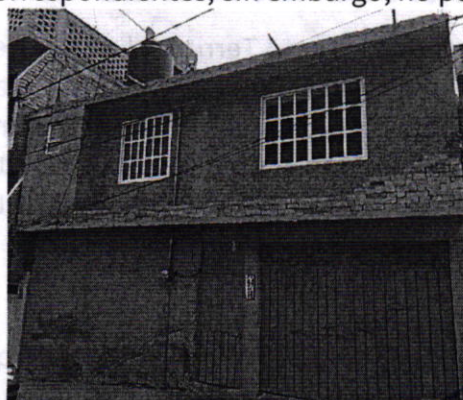
Fotografía 2. Vista del inmueble motivo de denuncia.

En seguimiento a la denuncia, se realizó un segundo reconocimiento de hechos por personal adscrito a esta Subprocuraduría, durante el cual se entrevistó con la persona presuntamente responsable de los hechos, quien manifestó ser propietaria de dos ejemplares caninos, hembra y macho, localizados en la azotea del inmueble de referencia, espacio en el cual a su decir, reciben los cuidados de bienestar animal correspondientes; sin embargo, no permitió el acceso a su domicilio.