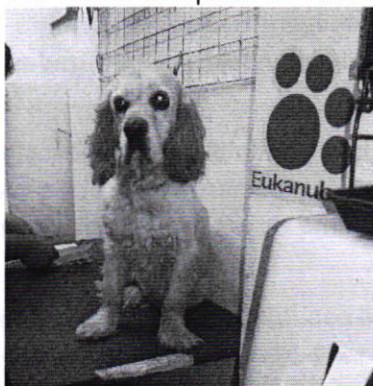
Figura 3. Vista del ejemplar canino "Jessica".

Mediante correo electrónico, la persona responsable del ejemplar canino que responde al nombre de "Jessica", informó que su animal recibió la atención médico veterinaria correspondiente, remitiendo el documento emitido por el especialista encargado de su revisión, quien informó que el animal de compañía se encuentra sano, en perfecta condición y con carnet completo de vacunas.