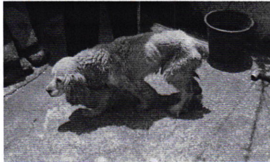
Figura 1. Ejemplar canino motivo de denuncia.

Derivado de lo observado, se realizó la siguiente recomendación: