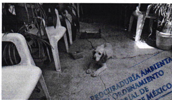
Figuras 4 y 5. Vista del ejemplar canino "Jessica".