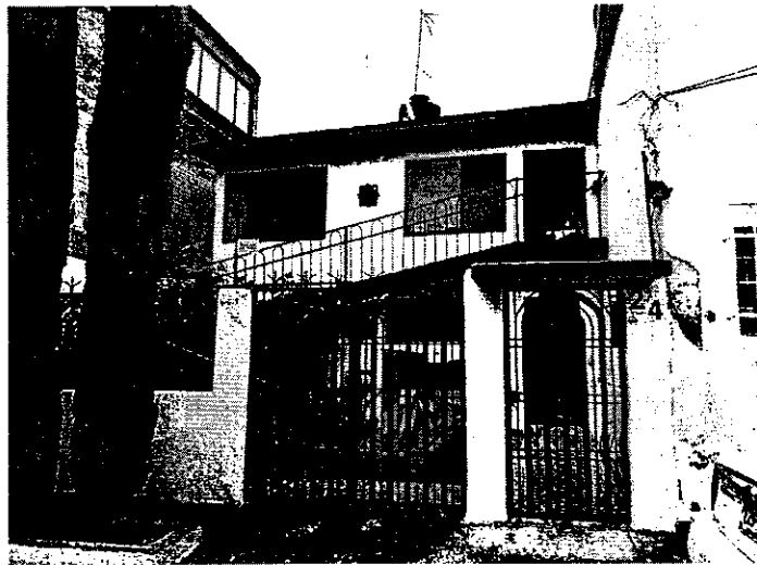
En la imagen se observa la fachada del inmueble.

Por lo anterior, se realizó visita de reconocimiento de hechos en la que el habitante del inmueble refirió que con la finalidad de no causar molestias a los vecinos dejó la madera por lo que actualmente utiliza acrílico y las piezas son pintadas a mano, aunado a lo anterior, se realizó un recorrido al interior del inmueble en la que no se constató la existencia de maquinaria o materiales que indique que se trate de un taller que fabrique piezas de madera.