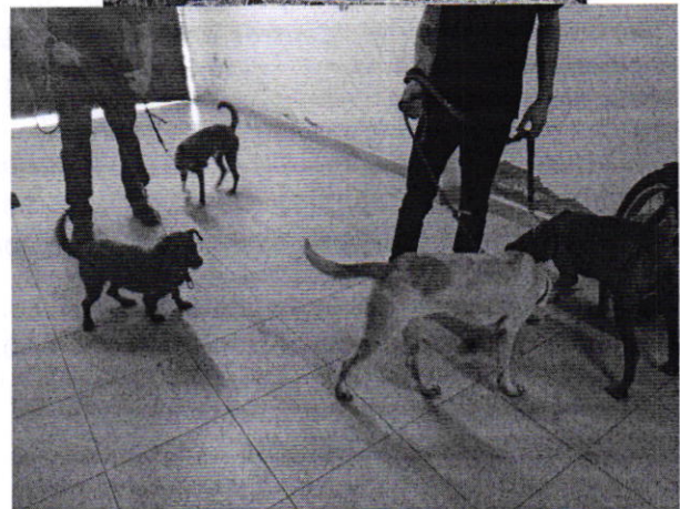
Figuras 2, 3, 4 y 5 1. Establecimiento mercantil denunciado.

En ese sentido, personal de esta Subprocuraduría realizó una consulta al Programa Delegacional de Desarrollo Urbano para Cuauhtémoc vigente, al predio en cuestión le aplica la zonificación HM/10/20 (Habitacional mixto, 10 niveles máximo de construcción, 20% mínimo de área libre); al respecto, una persona que dijo ser administradora del establecimiento mercantil en mérito, proporcionó copia simple del Certificado Único de Zonificación de Uso del Suelo Digital folio 10932-151ESGL21D con fecha de expedición de cinco de marzo de dos mil veintiuno, en donde el uso de suelo para centros antirrábicos, clínicas y hospitales veterinarios aparece como permitido según la norma de vialidad en tramo E-F del mapa delegacional.