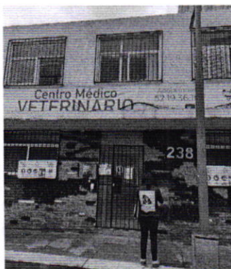
Figura 1. Establecimiento mercantil denunciado.