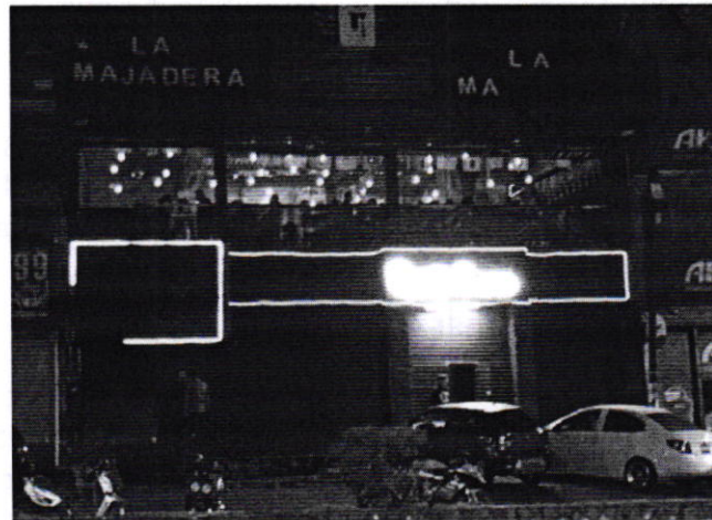
Figura 1. Vista del establecimiento mercantil denominado "La Majadera".

En este sentido, de las constancias que obran en el presente expediente, se desprende que personal de la Dirección de Estudios y Dictámenes de Protección Ambiental de esta Subprocuraduría se presentó al domicilio de la persona denunciante a realizar estudio de medición de emisiones sonoras, lo anterior con el objeto de determinar si excedían los límites máximos permisibles especificados en la Norma Ambiental para la Ciudad de México NADF-005-AMBT-2013. Durante dicha diligencia, el personal de esta Entidad constató que el único establecimiento de la zona en funcionamiento durante la diligencia era uno que exhibe el anuncio denominativo "La Majadera", el cual es diverso al señalado por la persona denunciante en su escrito de denuncia y en llamadas telefónicas realizadas, toda vez que se localizan en calles diferentes. En dicha diligencia la persona denunciante indicó que efectivamente el ruido que le molesta es el proveniente del denominado "la Majadera" y no el del "Club 757". De lo anterior se desprende que los hechos denunciados no se localizan en el inmueble denunciado.