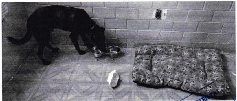
Figuras 1 y 2. Vista del ejemplar canino motivo de denuncia.

Es de resaltar que, en el Acuerdo de Admisión, que fue enviado por correo electrónico a la persona denunciante, se le hizo de conocimiento que contaba con un término de seis días hábiles para aportar las pruebas que estimara pertinentes en la investigación de los hechos, lo anterior conforme al artículo 90 del Reglamento de la Ley Orgánica de la Procuraduría Ambiental y del Ordenamiento Territorial de la Ciudad de