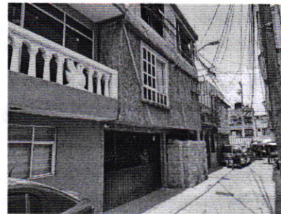
Figuras 1 y 2. Lugar de los hechos denunciados.

En virtud de lo antes expuesto, esta Entidad considera procedente emitir la presente resolución, de conformidad con el artículo 27 fracción VI de la Ley Orgánica de esta Procuraduría, por imposibilidad material, en virtud de que no se constataron los hechos, pues el domicilio no se localizó.