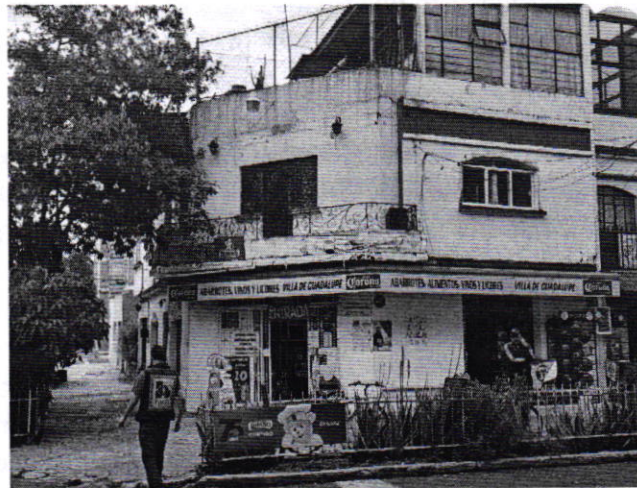
Figura 1. Establecimiento mercantil denunciado.

En este sentido, de las constancias que obran en el presente expediente, se desprende que personal de esta Procuraduría llevó a cabo una visita de reconocimiento de hechos, de acuerdo a lo establecido en el artículo 15 BIS 4 fracción IV de la Ley Orgánica de esta Entidad, diligencia durante la cual nos entrevistamos con una persona quien se ostentó como encargado del establecimiento mercantil motivo de denuncia denominado "Villa de Guadalupe", quien manifestó que anteriormente utilizaban una bocina para la reproducción de música grabada; sin embargo, dicho equipo se descompuso. En virtud de lo anterior, desde el espacio público no se constató la generación de emisiones sonoras por la reproducción de música que fueran susceptibles de medición acústica.