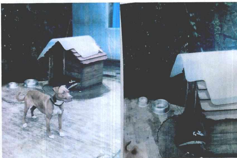
Fotografías.- Ejemplar canino motivo de la denuncia y sus condiciones de alojamiento.

PROCURADURÍA AMBIENTAL Y DEL ORDENAMIENTO TERRITORIAL DE LA CDMX