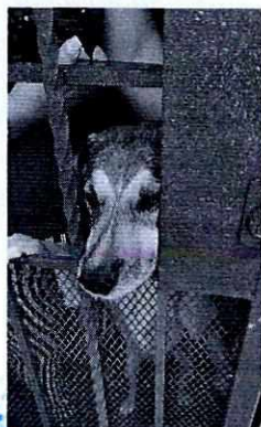
En la imagen se observa al canino de nombre "Tlacuache".