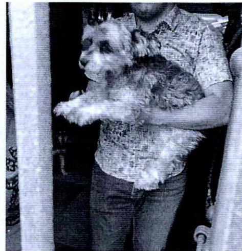
En la imagen se observa la canino "Duquesa".