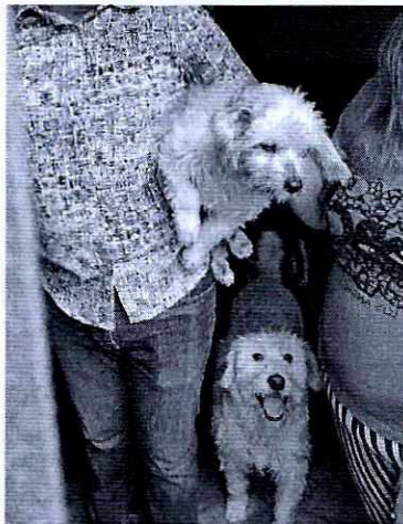
En la imagen se observa al canino "Hanna".