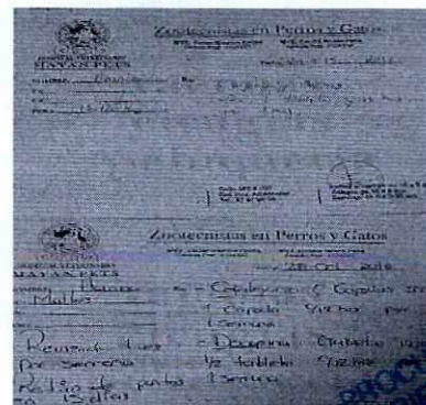
En la imagen se observan las recetas médicas de Hanna.