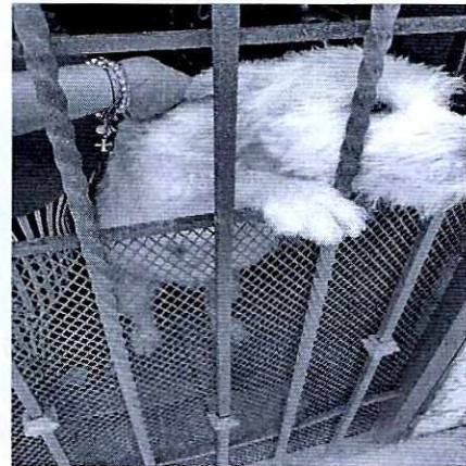
En la imagen se observa al canino "Simba".