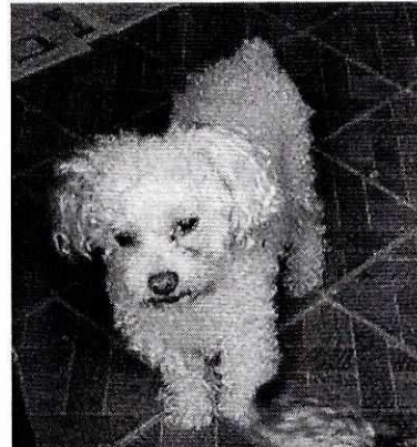
Fotografías 1 a 6. Ejemplares caninos antes descritos.

En razón de lo anterior, en el Acuerdo de Admisión, que fue enviado por correo electrónico a la persona denunciante con fecha 20 de agosto de 2019, se le hizo de conocimiento que contaba con un término de seis días hábiles para aportar las pruebas que estimara pertinentes en la investigación de los hechos, lo anterior conforme al artículo 90 del Reglamento de la Ley Orgánica de la Procuraduría Ambiental y del Ordenamiento Territorial de la Ciudad de México; sin embargo durante el procedimiento de investigación, no fueron proporcionados elementos de prueba que pudieran determinar incumplimiento a la normatividad en materia de bienestar animal.