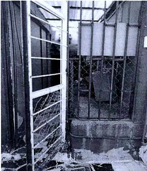
En la imagen se observa el lugar donde se alojaban los caninos.

En este sentido, de las constancias que obran en el presente expediente, se desprende que personal de esta Subprocuraduría llevó a cabo una visita de reconocimiento de hechos, de acuerdo a lo establecido en el artículo 15 BIS 4 fracción IV de la Ley Orgánica de esta Entidad, diligencia durante la cual el propietario de los ejemplares caninos, hizo de conocimiento al personal adscrito a esta Subprocuraduría que los ejemplares caninos que fueron señalados en el escrito de la denuncia, ya no se encuentran en el inmueble, lo anterior toda vez que señala que actualmente se encuentran en el Estado de Michoacán con la finalidad de que tengan más espacio. Cabe señalar que el personal de la PAOT constató que efectivamente no había algún ejemplar con las características descritas en la denuncia al interior del domicilio en cuestión.