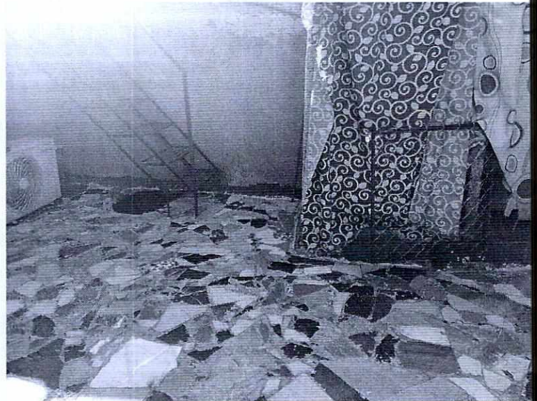
En la imagen se observa que no hay ningún canino en la azotea del inmueble.

En virtud de lo antes expuesto, esta Entidad considera procedente emitir la presente resolución, de conformidad con el artículo 27 fracción VI de la Ley Orgánica de esta Procuraduría, por imposibilidad material, en virtud de que dejaron de existir los hechos denunciados, al ya no encontrarse los ejemplares caninos en el lugar de la denuncia.