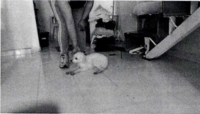
En la imagen se aprecia un canino al interior del inmueble.

No. Folio: PAOT-05-300/200- 123 23 -2022