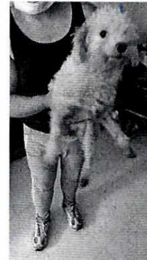
En la imagen se observa a uno de los ejemplares caninos.

Es de resaltar que, en el Acuerdo de Admisión, que fue enviado por correo electrónico a la persona denunciante, se le hizo de conocimiento que contaba con un término de seis días hábiles para aportar las pruebas que estimara pertinentes en la investigación de los hechos, lo anterior conforme al artículo 90 del Reglamento de la Ley Orgánica de la Procuraduría Ambiental y del Ordenamiento Territorial de la Ciudad de México; sin embargo durante el procedimiento de investigación, no fueron proporcionados elementos de prueba que pudieran determinar incumplimiento a la normatividad en materia de bienestar animal.