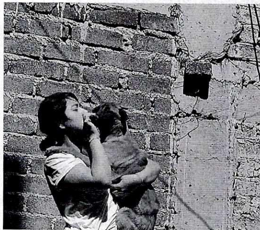
Figura 2. Ejemplar denunciado de nombre Osa.

Es de resaltar que, en el Acuerdo de Admisión, que fue enviado por correo electrónico a la persona denunciante, se le hizo de conocimiento que contaba con un término de seis días hábiles para aportar las pruebas que estimara pertinentes en la investigación de los hechos, lo anterior conforme al artículo 90 del Reglamento de la Ley Orgánica de la Procuraduría Ambiental y del Ordenamiento Territorial de la Ciudad de México; sin embargo durante el procedimiento de investigación, no fueron proporcionados elementos de prueba que pudieran determinar incumplimiento a la normatividad en materia de bienestar animal.