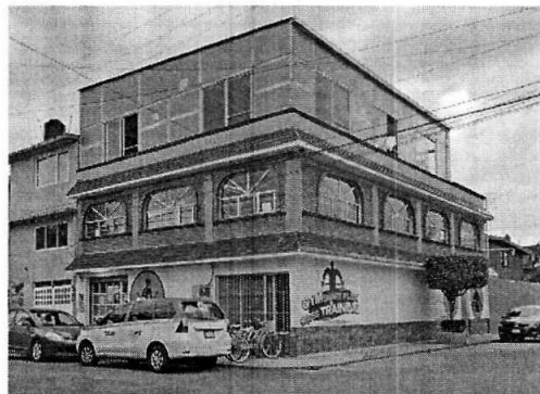
Se muestra el establecimiento motivo de la denuncia.

Por otra parte de acuerdo a las documentales que obran en el presente expediente, se desprende que personal de esta Subprocuraduría realizó un estudio técnico de emisiones sonoras desde el punto de denuncia, el cual tuvo como resultado que las actividades del establecimiento denunciado generan un nivel sonoro de 58.08 dB(A) , valor que no excede los límites máximos permisible de recepción establecidos en la Norma Ambiental NADF-005-AMBT-2013.