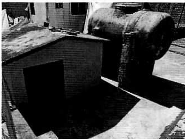
El ejemplar canino motivo de la presente denuncia cuenta con alojamiento y alimentación adecuada.

En relación al gato no se cuenta con ningún felino, señalando al respecto que su vecina es responsable de siete gatos que deambulan libre por las azoteas, sin que los agrede físicamente.