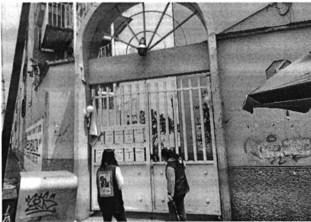
Figura 1. Lugar de los hechos denunciados.

En este sentido, de las constancias que obran en el presente expediente, se desprende que personal de esta Subprocuraduría llevó a cabo dos visitas de reconocimiento de hechos, de acuerdo a lo establecido en el artículo 15 BIS 4 fracción IV de la Ley Orgánica de esta Entidad, diligencia durante la cual la persona habitante del lugar donde se denunciaron los hechos objeto de la presente investigación, hizo de conocimiento al personal adscrito a esta Subprocuraduría que el ejemplar canino que fue señalado en el escrito de la denuncia, ya no se encuentran en el inmueble, lo anterior toda vez que lo dio en adopción a un familiar, es de señalar que al momento de la diligencia la persona visitada mostró un video al personal de esta Entidad donde se observa al ejemplar canino en su nuevo hogar. Cabe señalar que el personal de la PAOT constató que efectivamente no había algún ejemplar con las características descritas en la denuncia al interior del domicilio en cuestión.