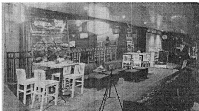
Se muestra el establecimiento denunciado.

En ese sentido, personal de esta Subprocuraduría llevó a cabo tres estudios técnicos de las emisiones sonoras producidas por el establecimiento denunciado, mediante los cuales se acreditó que el establecimiento denunciado generaba un nivel sonoro desde el punto de referencia de 83.38 dB(A), 76.00 dB(A) y 82.16 dB(A), valor que excedía los límites máximos permisibles establecidos en la Norma Ambiental NADF-005-AMBT-2013.