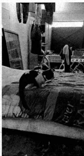
Figura 1. Ejemplar felino ubicado en el domicilio