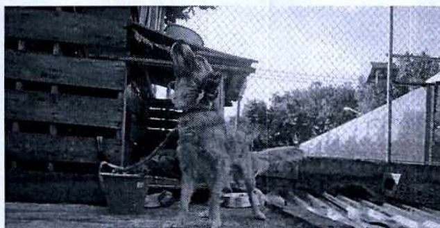
Fotografía 1. Ejemplar canino evaluado.

Por lo antes mencionado se sugirió a su persona responsable lo siguiente: