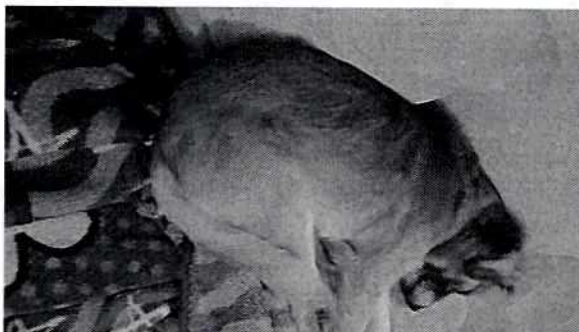
Fotografía 2. Ejemplar canino situado al interior del inmueble.

Con base en lo antes citado, esta Entidad considera que una vez que se dio atención a la presente denuncia por parte del personal adscrito a esta Subprocuraduría, se está en aptitud de emitir la resolución administrativa que conforme a derecho proceda, esto de acuerdo con la fracción VII del artículo 27 de la Ley Orgánica de la Procuraduría Ambiental y del Ordenamiento Territorial de la Ciudad de México, por el cumplimiento voluntario de las disposiciones jurídicas en materia de bienestar animal.