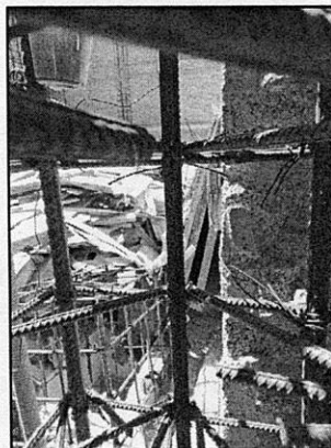
RECONOCIMIENTO DE HECHOS: 16 DE FEBRERO DE 2022

Esta Subprocuraduría, emitió oficio dirigido al Propietario, Representante Legal, Poseedor y/o Responsable de la Obra del inmueble objeto de investigación, a efecto de que realizara las manifestaciones que conforme a derecho corresponden y presentara las documentales que acreditaran la legalidad de los trabajos de construcción; sin que al momento de la emisión de la presente resolución, se cuente con respuesta. -----