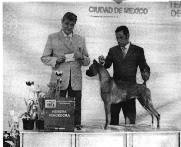
Figura 4. Ejemplares caninos “Shakira” Izquierda y “Azteca” derecha.