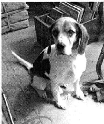
En la imagen se observa al canino "Charly"