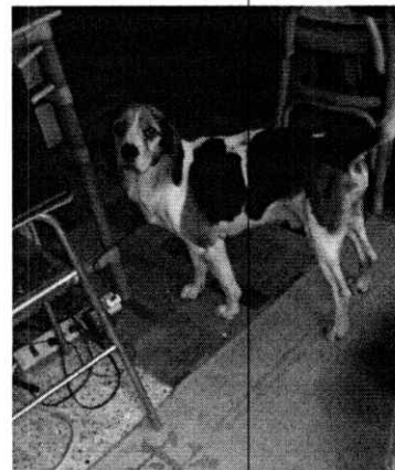
En la imagen se observa libre al canino.

Es de resaltar que, en el Acuerdo de Admisión, que fue enviado por correo electrónico a la persona denunciante se le hizo de conocimiento que contaba con un término de seis días hábiles para aportar las pruebas que estimara pertinentes en la investigación de los hechos, lo anterior conforme al artículo 90 del Reglamento de la Ley Orgánica de la Procuraduría Ambiental y del Ordenamiento Territorial de la Ciudad de México; sin embargo durante el procedimiento de investigación, no fueron proporcionados elementos de prueba que pudieran determinar incumplimiento a la normatividad en materia de bienestar animal.