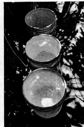
Fotografía 9. Bebederos limpios

En virtud de lo antes expuesto, esta Entidad considera procedente emitir la presente resolución, de conformidad con el artículo 27 fracción VII de la Ley Orgánica de esta Procuraduría, por el cumplimiento voluntario de las disposiciones jurídicas en materia de bienestar animal.