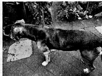
Fotografía 1, 2 y 3. Ejemplares caninos motivo de denuncia.