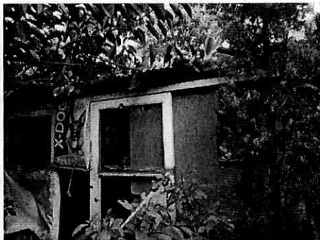
Fotografía 5. Lugar de alojamiento de los caninos.