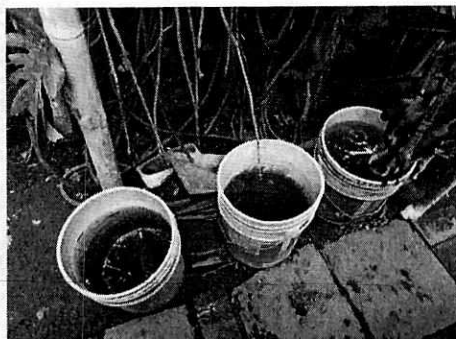
Fotografía 4. Bebederos sucios.