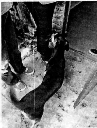
Fotografía 7. Canino retirado de la azotea