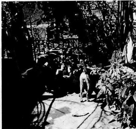
Fotografía 8. Caninos deambulando libremente.