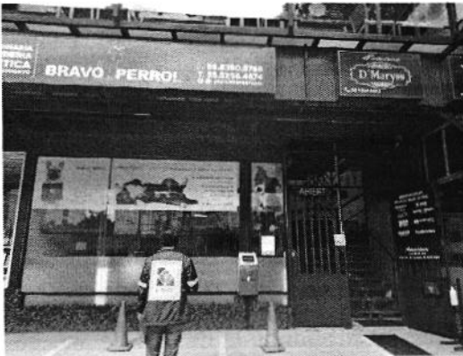
Figura 1. Fachada del establecimiento

En este sentido, de las constancias que obran en el presente expediente, se desprende que personal de esta Subprocuraduría llevó a cabo una visita de reconocimiento de hechos, de acuerdo a lo establecido en el artículo 15 BIS 4 fracción IV de la Ley Orgánica de esta Entidad, diligencia durante la cual una persona encargada del lugar donde se denunciaron los hechos objeto de la presente investigación, permitió dar un recorrido por las diferentes áreas del establecimiento, dichos espacios se observaron limpios. Se constató la presencia de 3 ejemplares caninos los cuales estaban en servicio de pensión y contaban con bienestar animal, pues uno de ellos se encontraba deambulando libremente en el área recreativa y otros dos en la zona de adiestramiento, todos contaban con agua limpia y alimento, consistente en croquetas a su libre disposición, y los espacios se observaron limpios.