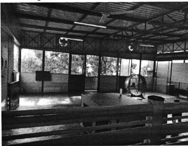
Figura 3. Área de Entrenamiento canino