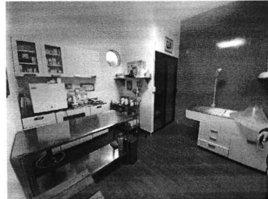
Figura 2. Área de Consultorio