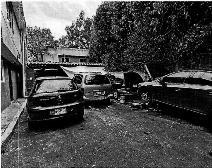
Fotografía 1. Exterior del establecimiento.

Al respecto, y de conformidad con el artículo 43 de la Ley de Desarrollo Urbano del Distrito Federal (ahora Ciudad de México), dispone que las personas físicas o morales, públicas o privadas, están obligadas a la exacta observancia de los programas y de las determinaciones que la Administración Pública dicte en aplicación de la citada Ley.