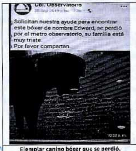
Ejemplar canino bóxer que se perdió.

En este tenor, el primer compareciente manifestó ser propietario de la hembra pitbull y el macho bóxer, los cuales se encontraban en buen estado físico y les brindaba los cuidados necesarios para garantizar su bienestar; no obstante, añadió que el bóxer deambulaba libremente en el domicilio, por lo que hace aproximadamente un mes el canino se había perdido y se encontraban buscándolo.