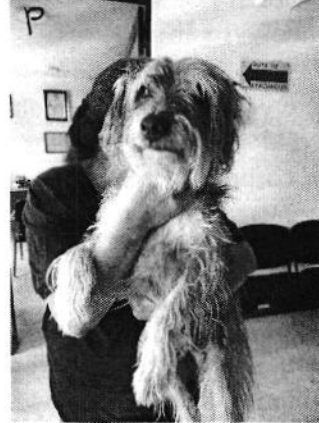
Ejemplar canino "Pulgas".