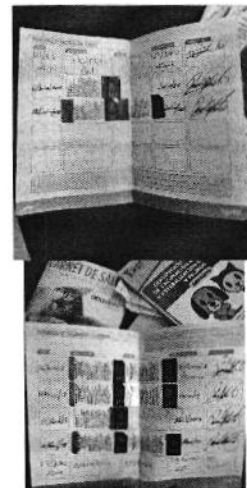
Figura 6. Cartillas de Vacunación.