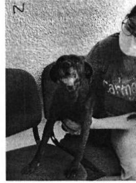
Ejemplar canino "Natasha".