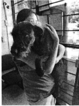
Ejemplar canino "Periann".

No. Folio: PAOT-05-300/200- F 2 4 0 11 -2022