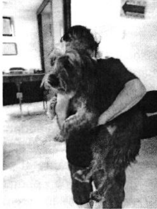
Ejemplar canino "Ebenine".