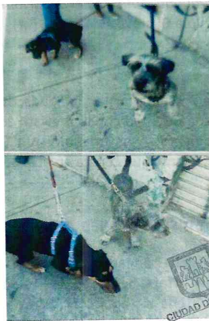
Fotografías.- Vista de los ejemplares caninos que se alojan en el inmueble