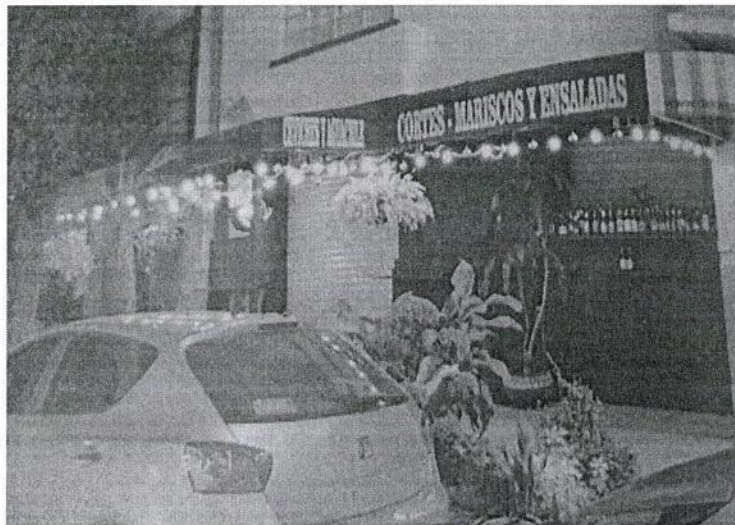
Fotografía 1. Se observa local comercial motivo de investigación

En relación con lo anterior, se notificó citatorio PAOT-05-300/210-2082-2019, a fin de que la persona propietaria, encargada y/o representante legal del establecimiento de mérito se presentara a comparecer, en las oficinas que ocupa esta Procuraduría. Al respecto, una persona que se identificó como responsable del establecimiento mercantil de mérito, se presentó a comparecer en las oficinas de esta Procuraduría, y exhibió original y copia simple de: