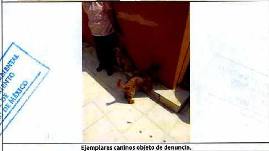
Ejemplares caninos objeto de denuncia.

Finalmente, mediante oficio se hizo del conocimiento de la persona responsable de los ejemplares caninos en comento, la legislación en materia de bienestar animal conminándola a su debido cumplimiento.