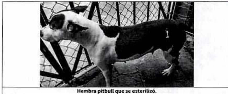
Hembra pitbull que se esterilizó.

Finalmente, mediante oficio se hizo del conocimiento de la persona responsable de los ejemplares caninos objeto de denuncia, la legislación en materia de bienestar animal conminándola a su debido cumplimiento.