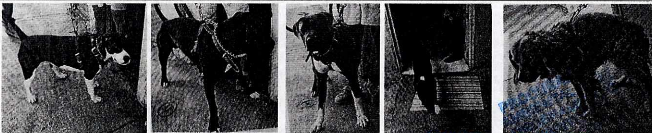
Vista de los caninos objeto de investigación.

Con base en lo antes citado, esta Entidad considera que una vez que se dio atención a la presente denuncia por parte del personal adscrito a esta Subprocuraduría, se está en aptitud de emitir la resolución administrativa que conforme a derecho proceda, esto de acuerdo con la fracción VI del artículo 27 de la Ley Orgánica de la Procuraduría Ambiental y del Ordenamiento Territorial de la Ciudad de México, por imposibilidad legal, al no constatar irregularidades en materia de bienestar animal.