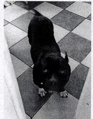
Imagen 1,2 y 3. Ejemplares caninos motivo de denuncia que responden a los nombres de "Kyra", "Alice" y "Lili".

En virtud de lo antes expuesto, esta Entidad considera procedente emitir la presente resolución, de conformidad con el artículo 27 fracción VI de la Ley Orgánica de esta Procuraduría, por imposibilidad legal, al no constatar irregularidades en materia de bienestar animal.