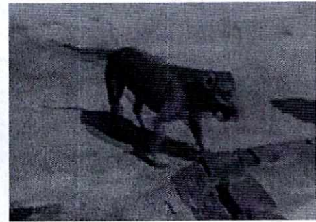
Fotografías. Vista de los caninos observados.

Finalmente, mediante el oficio correspondiente, se informó a la persona responsable de los ejemplares caninos objeto de investigación, las obligaciones previstas en la Ley de Protección a los Animales de la Ciudad de México al contar con un animal de compañía, conminándola a su debido cumplimiento.