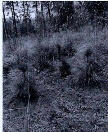
Imagen 1 y2. Restitución de los individuos arbóreos.

En ese sentido, se desprende que los derribos realizados en calle Cerrada Mixco sin número, colonia San Salvador Cuauhtemoc, Alcaldía Milpa Alta, fueron restituidos con 100 ejemplares arbóreos plantados y ubicados por la zona de la afectación.