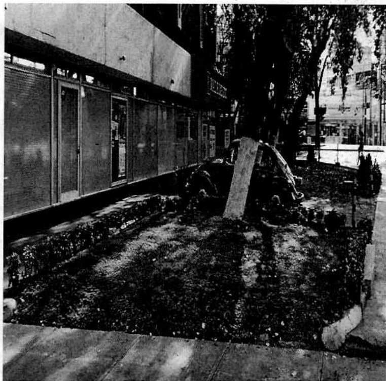
Fotografías 1 y 2. Vista del área verde afectada y después de su restauración.

En virtud de lo antes expuesto, esta Entidad considera procedente emitir la presente Resolución Administrativa, de conformidad con el artículo 27 fracción VII de la Ley Orgánica de esta Procuraduría, por el cumplimiento voluntario de las disposiciones jurídicas en materia de áreas verdes.