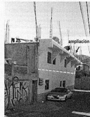
Fuente: Reconocimiento de hechos realizado por PAOT. Diciembre de 2021

En virtud de lo anterior, se solicitó a la Dirección General de Asuntos Jurídicos y de Gobierno de la Alcaldía Gustavo A. Madero, instrumentar visita de verificación en materia de construcción (remodelación, ampliación y demolición), por los trabajos de obra realizados en el inmueble de interés, e imponer las medidas de seguridad y sanciones procedentes. -----