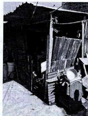
Fotografía 2- Se muestra el cuarto de alojamiento de ejemplar canino.

Medellín 202, piso 4, colonia Roma Norte Alcaldía Cuauhtémoc, C.P. 06700, Ciudad de México Tel. 5265 0780 ext 12011 y 12400