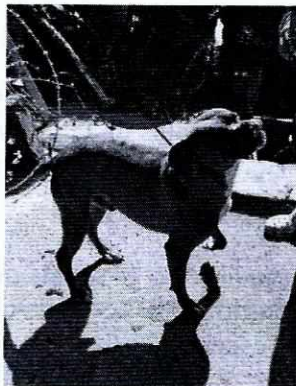
Fotografía 1. Se muestra al ejemplar canino, raza Bóxer.

Finalmente, esta Entidad exhortó a la persona propietaria del ejemplar canino a brindarle la atención médica mediante el esquema de vacunación de acuerdo a su edad, para reforzar su sistema inmunológico a fin de evitar enfermedades graves y potencialmente mortales, así como la atención médico veterinaria que en su caso puedan requerir.