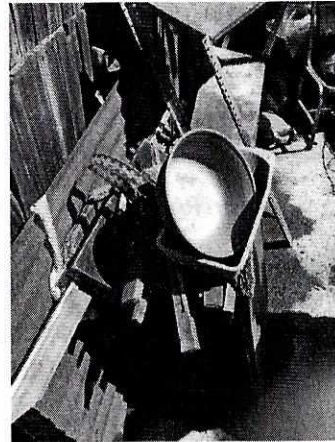
Fotografías 3-4.-Se muestra los recipientes y el lugar de alojamiento del ejemplar canino.

En virtud de lo antes expuesto, esta Entidad considera procedente emitir la presente resolución, de conformidad con el artículo 27 fracción VI de la Ley Orgánica de esta Procuraduría, por imposibilidad legal, al no constatar irregularidades en materia de bienestar animal.