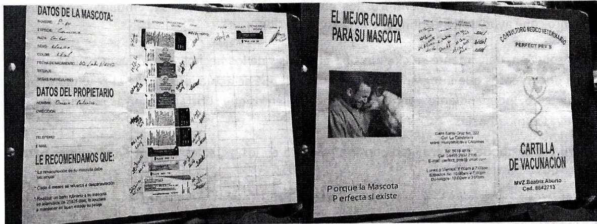
Fotografías 4 y 5. Muestran la cartilla de vacunación de ejemplar canino raza cocker spaniel, ubicado en Calle Paseos de los Jardines número 355, colonia Paseos de Taxqueña, Alcaldía Coyoacán.

No. de Folio: PAOT-05-300/200- 4108-2020