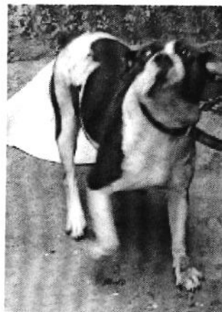
Ejemplar canino "Manchas".