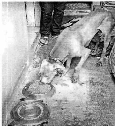
Imagen 1. Canino Weimaraner llamado "Drako"