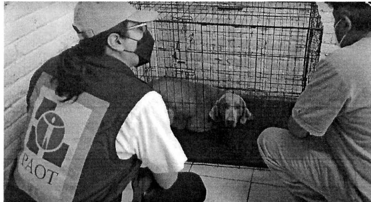
Imagen 3. Personal de esta entidad en coadyuvancia con la Brigada de Vigilancia Animal SSC

Derivado de lo observado por personal de esta Entidad, la persona responsable del ejemplar, lo entregó de manera voluntaria a la Brigada de Vigilancia Animal de la Secretaría de Seguridad Ciudadana para su resguardo.