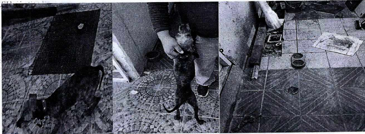
Fotografías 5 y 6. Ejemplar canino "Maluma".