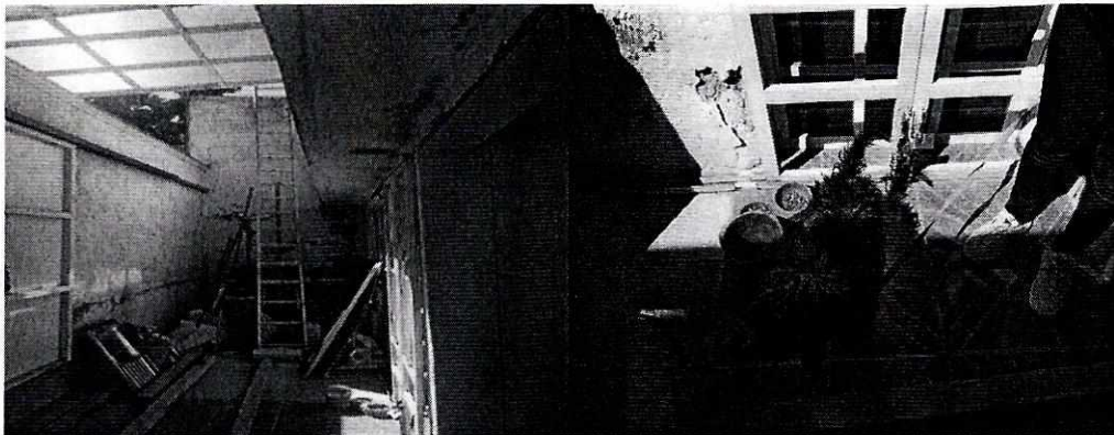
Fotografías 1 y 2. Sitio de alojamiento (Izquierda) y ejemplar canino motivo de denuncia (derecha).