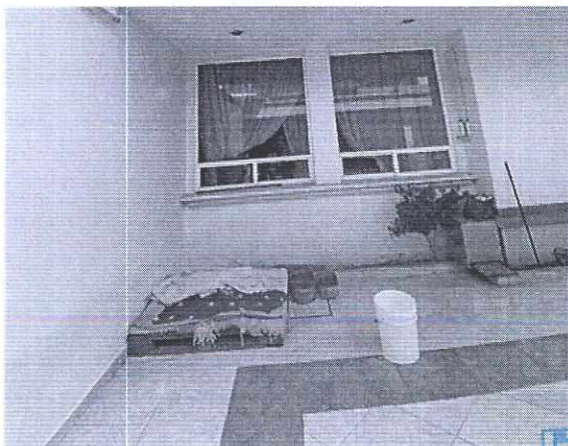
Figura 1. Lugar de descanso