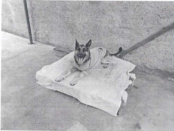
Figura 3. Ejemplar denunciado