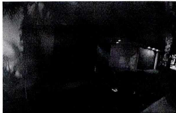
Se muestra el inmueble motivo de la denuncia

En este sentido, personal de esta Subprocuraduría realizó dos visitas de reconocimiento de hechos de acuerdo a lo establecido en el artículo 15 BIS 4 fracción IV de la Ley Orgánica de esta Entidad, en las cuales se constató la existencia de una casa de un nivel de construcción sin indicios de la existencia de algún establecimiento mercantil; asimismo, no se constató la realización de algún evento en el inmueble denunciado.