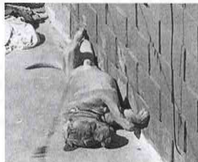
Vistas del 16 de enero de 2015

Con el objeto de allegarse de mayor información que permita substanciar la investigación en materia de maltrato animal, esta Subprocuraduría cito a presentarse al propietario y/o poseedor de dichos ejemplares caninos. Sin embargo, a la fecha de emitir la presente Resolución Administrativa, no se ha presentado persona alguna a atender el citado requerimiento.