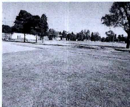
Se muestra el área verde motivo de la denuncia

Se tuvo comunicación con un trabajador, quien manifestó que se tuvo un concierto de rock en el deportivo, sin embargo; la zona motivo de la denuncia no fue utilizada y que los trabajos de mantenimiento constatados se debían a la petición de los usuarios de los campos de beisbol.