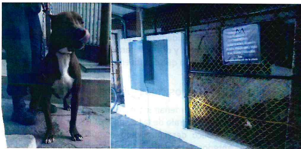
Fotografías.- Ejemplar canino motivo de la denuncia y sus condiciones de alojamiento: