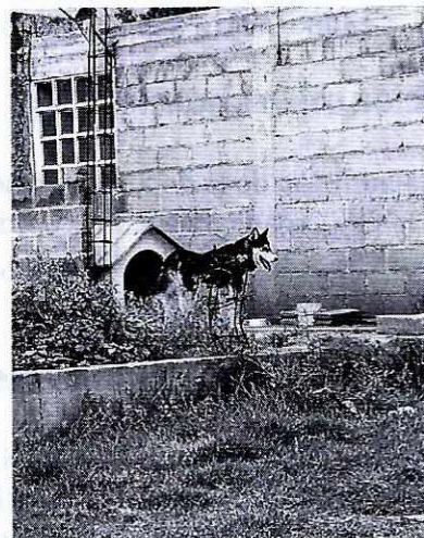
Imagen 2. Cánido motivo de denuncia.

En seguimiento a la presente investigación, personal adscrito a la Subprocuraduría de Asuntos Jurídicos de esta Procuraduría, recibió un correo electrónico, en el cual la persona denunciante manifestaba que el cánido motivo de denuncia ya no se encontraba en el domicilio referido anteriormente, toda vez que presenció cuando el propietario lo retiraba del lugar.